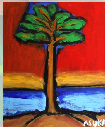
希望の一本松(田崎飛鳥)